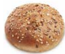
Ref. 1068 Burguer multicereales 70gr Caja 30 unidades