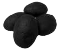
Ref. 1030 Mini mollette negro 25gr Caja 50 unidades