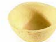
Ref. 1007 Tartaleta Gourmande redonda 41x21mm 4gr Caja 96 unidades