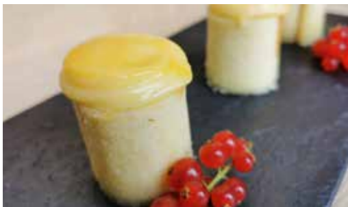
PIONONOS de crema 50gr Ref. 1037 24 unidades