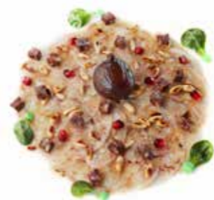
Carpaccio de manitas de cerdo 70gr Ref. 966 10 raciones