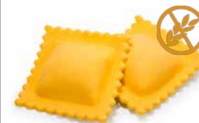
Ravioli ricotta y espinacas sin gluten 14gr Ref. 1028 3kg