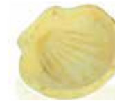
Ref. 1010 Mini concha 51x46x8mm 4gr Caja 120 unidades