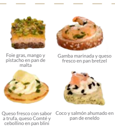
Foie gras, mango y pistacho en pan de malta