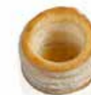
Ref. 1016 Vol au vent 35 35x25mm 6gr Caja 192 unidades