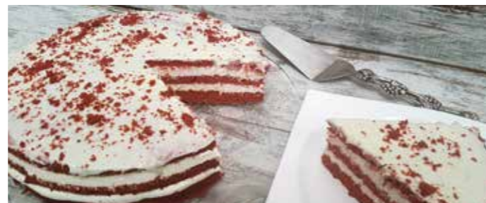
Red Velvet 2kg Ref. 1067 1 tarta