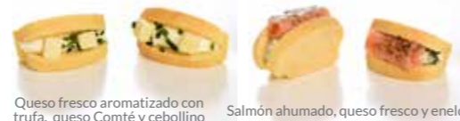
Queso fresco aromatizado con trufa, queso Comté y cebollino