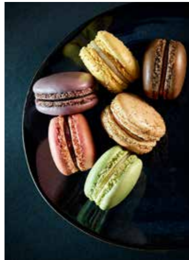
MACARONS Emotion 13gr

Ref. 998 6 variedades: chocolate-naranja, frambuesa-grosella, plátano-coco rallado, limón-lima, cassis, galleta Speculoos 36 unidades