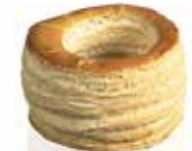
Ref. 1019 Vol au vent 65 65x50mm 22gr Caja 90 unidades