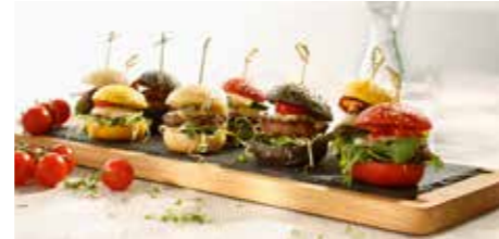
Ref. 1003 Surtido micro burger de colores 18gr Caja 160 unidades