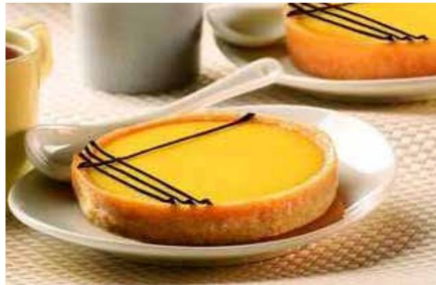
Tartaleta de limón 80gr Ref. 1022 10 unidades