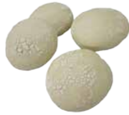
Ref. 1031 Mini mollette redondo 40gr Caja 50 unidades