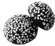
Ref. 903 Mini brioche negro 10gr Caja 100 unidades