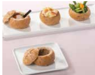
Ref. 1006 Mini bol de pan 20gr Caja 50 unidades