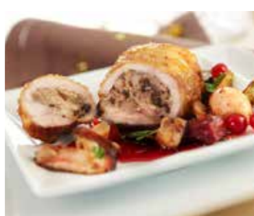
Muslo de pollo deshuesado crudo relleno boletus 160gr Ref. 1032 Caja 4,8kg