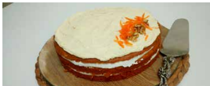
Carrot cake 2kg Ref. 1036 1 tarta