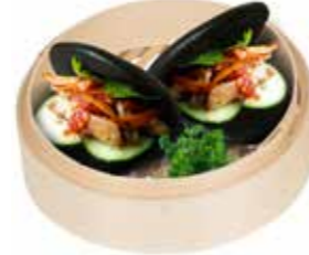
Ref. 1054 Pan gua bao negro 20gr Caja 1kg