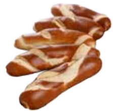
Ref. 1023 Barrita bretzel 70gr Caja 32 unidades