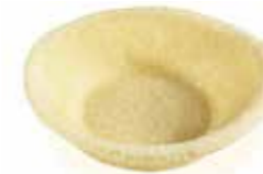
Ref. 1015 Mini tartaleta 48x14mm 4gr Caja 120 unidades