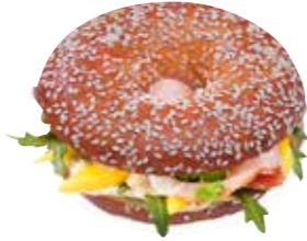
Ref. 1002 Bagel sésamo bretzel precortado 85gr Caja 60 unidades