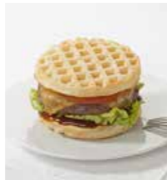
Ref. 1005 Gofre harina de centeno 30gr Caja 72 unidades