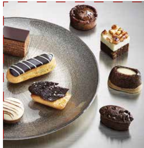
PETIT FOURS Elegance&chocolat 15gr

Ref. 998 6 variedades: chocolate-naranja, frambuesa-grosella, plátano-coco rallado, limón-lima, cassis, galleta Speculoos 36 unidades