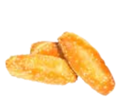
Ref. 1024 Mini navette bretzel 25gr Caja 140 unidades