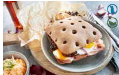
Ref. 1001 Bocadillo rústico precortado 120gr Caja 28 unidades