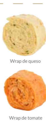
Wrap de queso