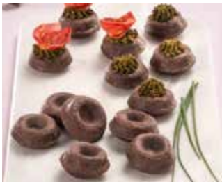
Ref. 1004 Mini moelleux de oliva negra 6gr Caja 200 unidades