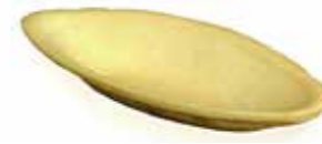
Ref. 1009 Mini barquillo 100x35x15mm 6gr Caja 80 unidades