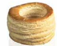
Ref. 1017 Vol au vent 85 85x45mm 40gr Caja 72 unidades