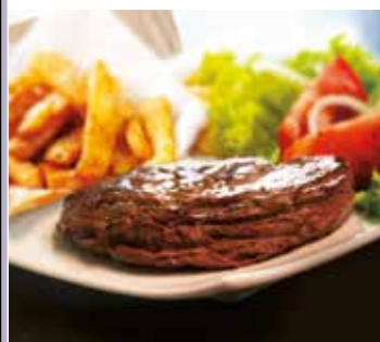
Carpa'Chaud 150gr Ref. 1040 10 unidades