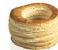
Ref. 1018 Vol au vent 70 70x45mm 27gr Caja 90 unidades