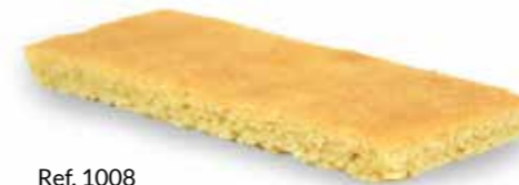
Ref. 1008 Base bizcocho rectangular 100x10x10mm 22gr Caja 90 unidades